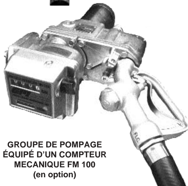
GROUPE DE POMPAGE ÉQUIPÉ D'UN COMPTEUR MECANIQUE FM 100 (en option)